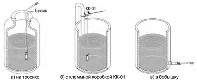
Рисунок 2 – Примеры монтажа на объекте

Для более удобного монтажа преобразователя рекомендуется использовать клеммную коробку КК-01 производства фирмы OWEN. Клеммная коробка позволяет зафиксировать преобразователь на вертикальной плоскости или вертикальной трубе, а также выполнить стыковку сигнального кабеля с капилляром преобразователя с обычным сигнальным кабелем внешних устройств. Клеммная коробка КК-01 доступна по отдельному заказу.